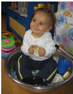
Begriffe erfassen Worte zuordnen Dinge benennen