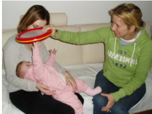
Geräusche erleben Sprache entdecken