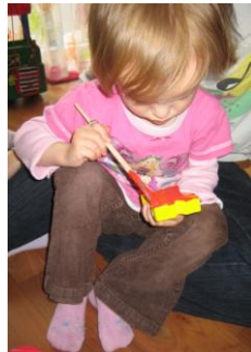
Sprachliche Interaktion im gemeinsamen Tun

Frühförderung ist ein kostenloses Angebot für Familien mit hörbeeinträchtigten und gehörlosen Kindern.